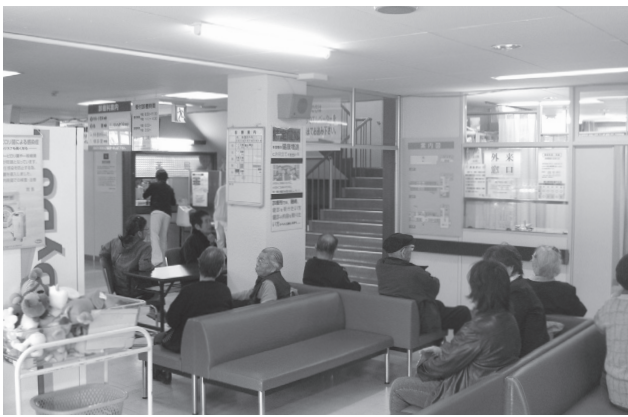
診療所内外来待合室。新体制となり、多くの患者の受診が期待される。