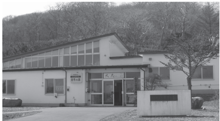
今後も存続し続ける青年の家