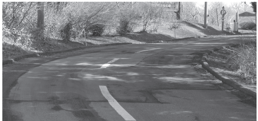
改修の優先度が高い判官館森林公園の町道

道政建設水道課長 比字川、元神部川、アクマップ川、浦里川の4河川で、5項目の水質検査を行う。目的は河川管理者として、水質状況の把握と汚濁や流入時の基準の水質を把握するため。