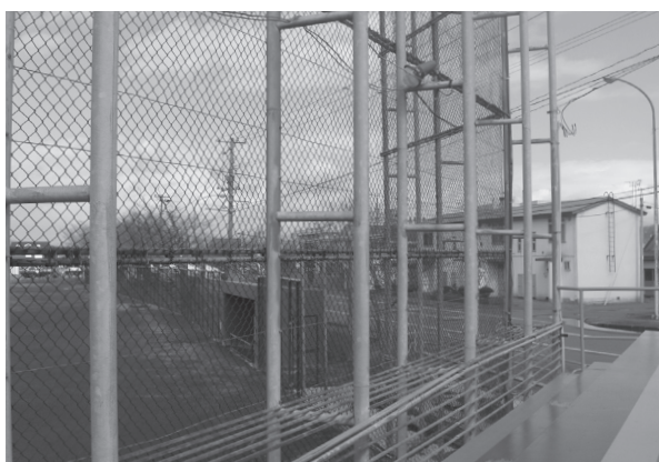
1日も早い張替えが望まれるバックネット