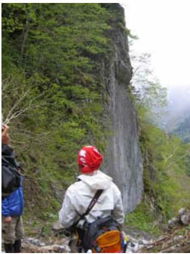
▲6月1日の調査、「大理石の沢」にて石灰岩の露頭をのぞむ

新冠町の地質は、泉地区を境に大きく2分されるといわれています。海岸部の方は第三紀といわれる比較的新しい地質、そして奥地の方は古生代や中生代といった古い地質に属します。奥新冠には、石灰岩に囲まれた場所が多数確認で