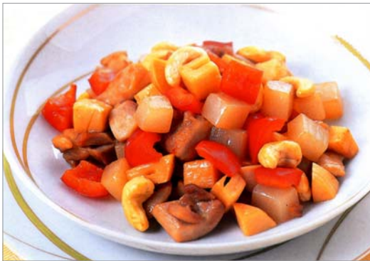
【鶏肉とカシューナッツのオイスターソース炒め】

よく噛んで食べることは、歯や歯ぐきを丈夫にするのももちろん、食べすぎを防止し、ダイエット効果もあります。年をとっても自分の歯でおいしく食べることができるよう、噛む力を必要とする食材を上手に組み合わせたお料理を作ってみましょう