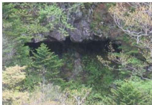
▲奥新冠ダムの付近であやしき？穴を発見、その場所までは遠すぎて行けず。カメラを望遠にして撮影。

自身6月1日の調査に同行しましたが、残念ながら鍾乳洞のような穴は発見されませんでした。これまでも新冠に鍾乳洞があったと報告されたことは現在のところありません。ただ、石灰岩は水に溶けやすいので小規模な鍾