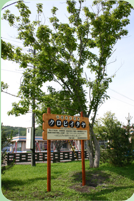
場所：新冠町字中央町 (郷土資料館前庭) 樹木の太さ：約 15cm