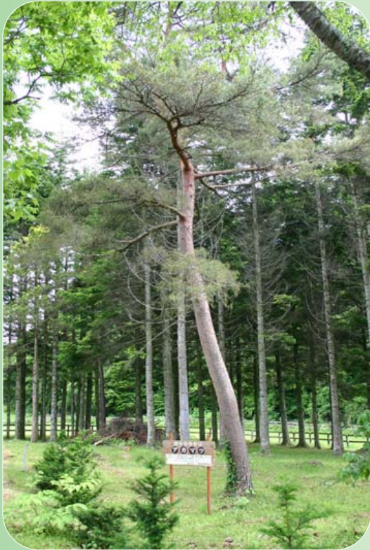
場所：新冠町字万世 (万世生活館裏) 樹木の太さ：約 0.5 m