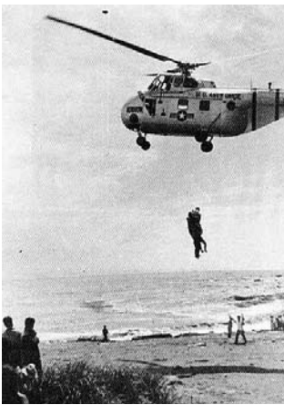
▲米軍ヘリによる救出模様

平成15年の水害では厚別川でも氾濫し、尊い命や農林業に多大な被害を及ぼしました。豪雨や地震の災害はいつ起こるかわかりません。これらのことをいつまでも忘れずに、自然の偉大さと怖さを再認識して日頃から防災の意識を高めることも大切かと思われま