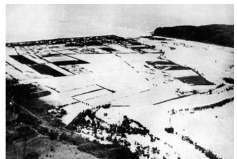
▲市街地の浸水状況