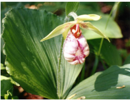
▲判官館のクマガイソウ