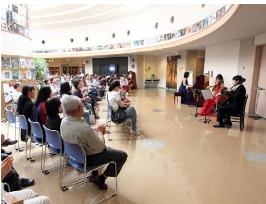
▲6月11日、レ・コード館誕生祭ロビーコンサートの様子

本年度5回目となります。レ・コード館誕生祭を6月11日に開催いたしました。ミュージアムやレ・コードホールを1日無料開放するとともに、全国的にバイオリニストとして活躍をされている方のピアノトリオロビーコンサート、夜の部では、自主企画主催の「ラテ」ジャズコンサート、道の駅ゾーン特別企画等の催しが実施され、大変好評に終了することができました。