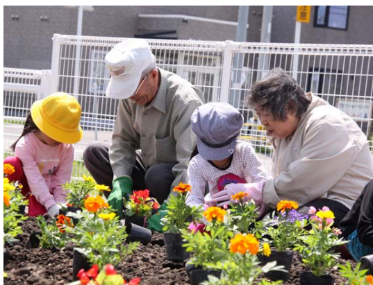
▲5月23日、地域自治会と園児による花壇作りの様子

次に、「学校支援地域本部事業」についてであります。新学習指導要領により今年から小学校5、6年生における外国語の授業がスタートしたこと