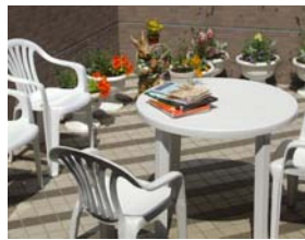
9月末までの天気の良い日に開放中

今年は白いプランターにたくさんの花を植えて素敵なガーデンになりました。青空の下でいつもとちょっと違った読書の時間を楽しんでみてはいかがでしょうか？