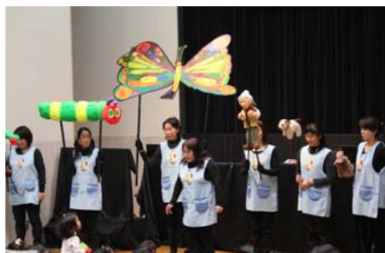
※昨年行われたお楽しみ会の様子