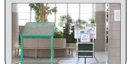
役場ロビーに設置している回収箱