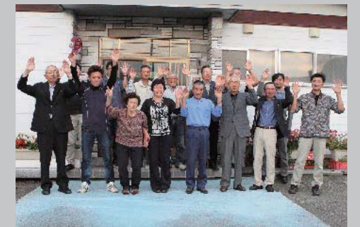
10月5日 スノードラゴン号スプリンターズS優勝