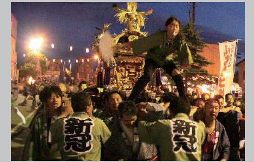
7月19・20日 にいかつぷふるさと祭