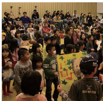
秋のおたのしみ広場

レ・コード館ジュニアジャズバンド定期演奏会がレ・コード館において交流演奏を交え開催されました。町民センターにおいて幼児、保護者230名の多くの参加を得て「秋のおたのしみ広場」が実施され音楽鑑賞や楽器づくりなど親子で楽しむ1日となりました。