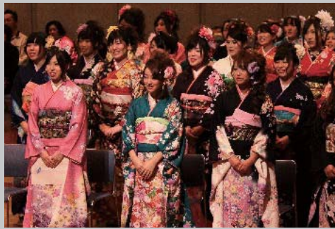
1月12日 平成26年成人式