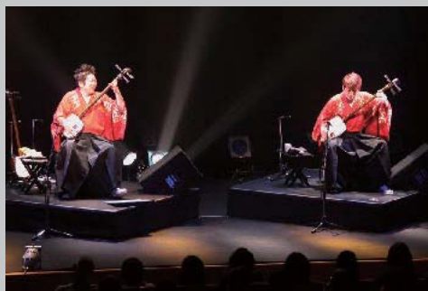
6月14日 吉田兄弟コンサート