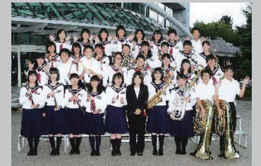
9月5日 新冠中学校吹奏楽部全道大会出場