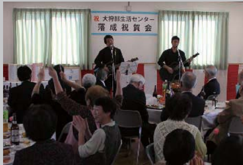
1月19日 大狩部生活センター落成祝賀会