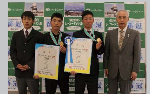
10月20日 長崎国体少年団体馬術競技優勝