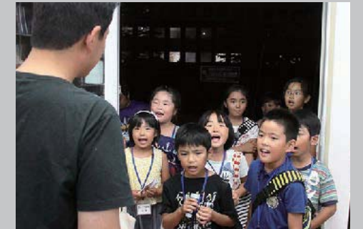
8月7日 青年団体連絡会議主催ロック出せ