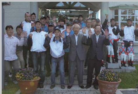
6月1日 ワンアンドオンリー号ダービー制覇