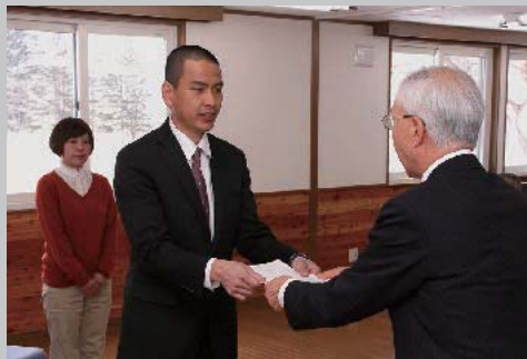
3月3日 農業支援員卒業生第一号