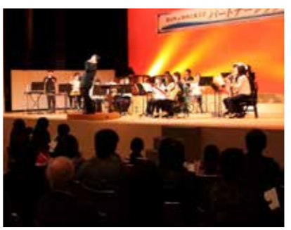
音楽体験・交流事業