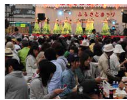
ふるさと祭り事業