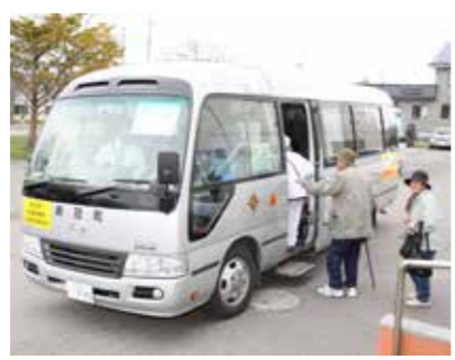
地域コミュニティバス運営事業