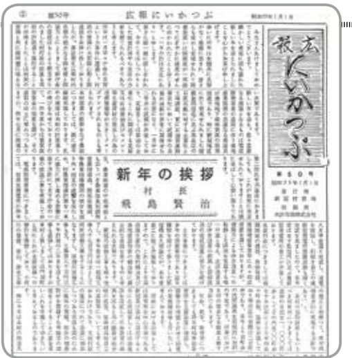
飛島村長の新年の挨拶

また、現在も主要な道路である国道235号線の「新冠橋」の橋りよう工事が始まったのもこの年で、『これにより高沿線生産物の集約輸送及び奥地建設物資の輸送などに劃期的な役割を果たすものと考えられる』と記載されています。