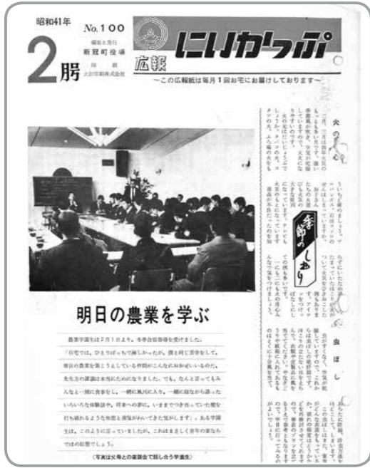
青年の家で開かれた農業学園を紹介した表紙

『明日の農業を学ぶ』と題されたこの広報誌では、日高判官館青年の家で行われた新冠町農業学園の冬季合宿教育の一コマが掲載されています。『農業学園は、2月1日より、冬季合宿指導を受けました。』