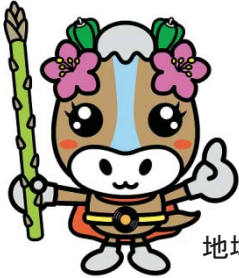
地域見守りキャラクター にいかっぷん

お隣やご近所で、「いつもと違う」「何かおかしい」といった状況に気付いた時、地域包括支援センター(保健福祉課)まで連絡をする役割があります。『さり気ない見守り』を中心とした活動であり、責任や負担はありません。この活動に賛同いただける方は、下記までお問い合わせください。