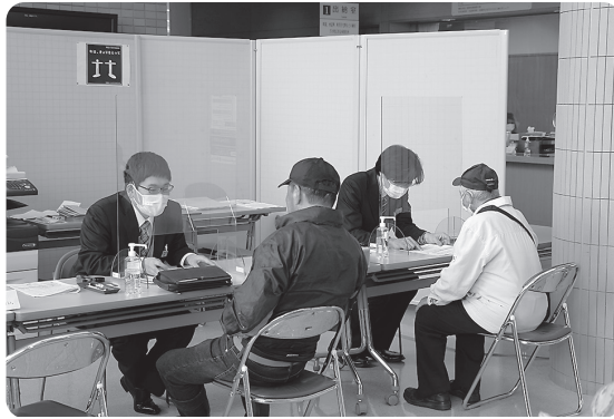
特別定額給付金受付の様子

5月29日現在、オンライン申請61名、郵便申請3895名、窓口申請1098名、合計5054名、5億540万円。対象者5446名に対し、申請率92・8%となっている。