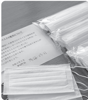
配布されたマスク

感謝と応援の手紙を受け取っている。また、高齢者宅の健康確認の電話の際にも感謝の言葉ももらっている。