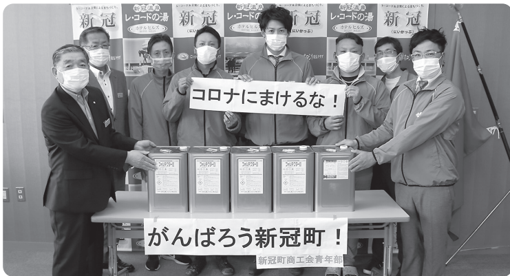
子どもたちのために消毒液の寄付（商工会青年部）

贈に対しては、お礼状を差し上げ町広報で感謝をお示ししている。現在、感謝状の明確な判断基準の必要性を感じ、規程の整備を進めている。町表彰条件に該当するものを除き、金品の寄附、地域貢献活動等による町政の振興、町民の福祉増進に寄与された方を対象予定としている。 感謝状贈呈により、地域に対するさらなる協力が生み出され、地域をより元気にする活動が促進されることを期待したい。