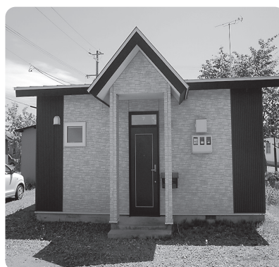
移住促進住宅「ナナカマド」

この住宅の制度のあり方としては、町内に定住してもらうきっかけづくりとしているため、敷金等を設ける考えはない。