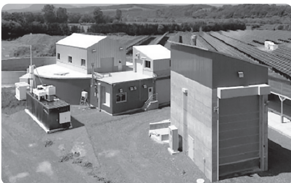
バイオガス発電（興部町）

ついては理解するが、事業の継続性や受益者負担、長期間の調査期間、送電網の問題等解決しなければならぬ課題やそれに伴う町財政を理解願いたい。