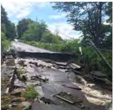
平成28年8月に発生した災害で被害を受けた町道

今後、地域の皆さんの同意をもらえような場所があれば、再度検討していきたいと思えます。 また、現在、防災マップも含めた防災対策の見直しを検討しており、地域の方々の意見も聞きながら進めたいと考えておりますので、ご協力をお願いします。