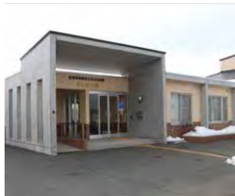
平成11年に建設された 高齢者共同生活施設「あいあい荘」

町では、平成30年に今後5年間の公営住宅やあいあい荘などの施設も含めた住宅施策に関する計画や見直しをする時期となりますので、いただいた意見なども参考に計画の見直しを進めていきます。