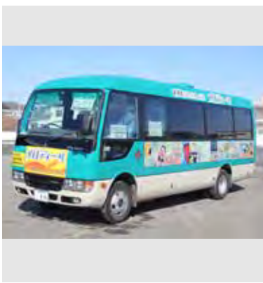
毎日約100名の乗客が利用している 地域コミュニティバスメロディー号

出てくることなどを考えると、すぐにルートを見直すことは難しい状況ですが、ご意見を参考にしながら検討していきたく思います。