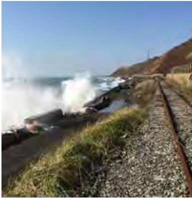
損壊などの被害が拡大している J R日高線横の堤防

ぜひ、これまでの経過も含めJ Rに適正な対応を要望していただきたい。 回答 J R日高線は、平成27年1月災害による運休以来、管内7町が一体となりJ R北海道、北海道、国に要望、要請活動を行っています。復旧には、