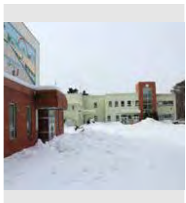
昭和57年に完成した朝日小学校校舎と体育館