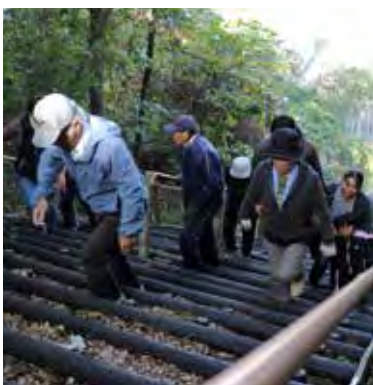
町防災訓練で、避難階段を使い高台に避難する様子

また、斜めにすると土砂崩れなどを引き起こす可能性も出てくることから、現在の形になった経緯があります。また、少し傾斜が緩い避難経路として、神社の裏からも避難階段が設置されていることから、どちらかを使い避難してもらえればと思います。