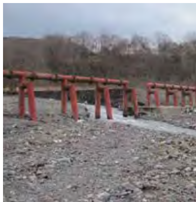
現在の比字川上流の様子 (流木が撤去された状況)

回答 砂防ダムは、スリット式にする前は、土砂を全部止める方法をとっていましたが、この方法だと、平成15年災害時のように、大雨によって大災害につながると考えられるようになり、現在は、新しくスリット式を採用しているという経緯があります。町としては、定期的に現地を確認するとともに、必要に応じて、土砂や流木の撤去など河川の適正な管理を国や道に要請していきます。