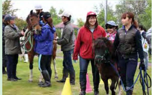
認定こども園での訪問乗馬の様子

これからも、町民がサラブレッドと触れ合える、馬産地ならではの事業を実施していきます。