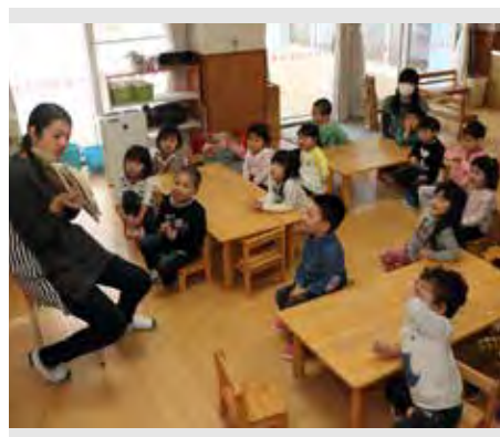
朝の会で絵本の読み聞かせを聞く 認定こども園ばなな組の園児

現在の町内の子ども数をみると、入園希望のある世帯に対しては、現在の状況の中で対応できると考えています。