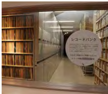
データ登録を終えたレコードが 保管されているレ・コードバンク

新冠町の財産として大切に保管するというもので、今後も、レコードを見て、聞いてもらうことを中心とした活用を図っていきたく思います。レ・コード館は、まちのシンボルであり、まちづくりの象徴としての位置づけもありますので、20周年を機に、町長部局の企画課と話し合いをしながら、今後のレコードの活用、館の運営方法について協議検討を進めていきます。