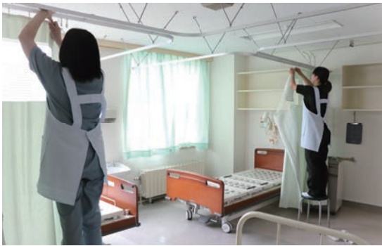
病床再開に向け準備を進めている 国保診療所の様子

これから医師をはじめとする医療スタッフとともに、国保診療所をこれまで支えてくれた多くの皆さま、これからも支援・応援してくれる皆さまの思いを大切に、信頼される地域医療を目指してまいります。