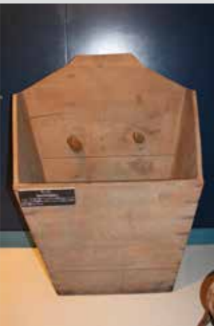
郷土資料館に展示している「木製モッコ」

モッコという名前の由来は、辞典によると「もちこ（持籠）が変化した語」とあり、「藁葎（わらむしろ）や藁縄を、網に編んだものの四隅に綱をつけて、土・石などを盛り、棒で担って運ぶ具」と説明されています。木製箱型のもものは、江戸時代の末期には使用され、イワシやニシン漁に伴って多く使用されていました。運搬方法から、二人またはそれ以上で運ぶものと一人で運ぶもの、材質から藁や樹皮などでできたものや竹や蔓などを編んでいるもの、使用する立場から大人用