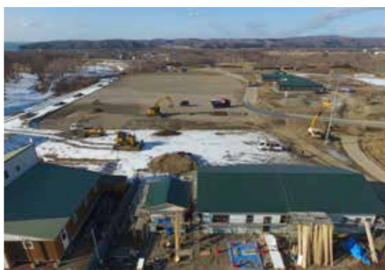
『にいかっぶホロシリ乗馬クラブ』移転先での施設整備の様子

にいかっぶホロシリ乗馬クラブは、現在、開発局で進めています。日高自動車道のルート上にあることから、施設の移転先を西泊津のパークゴルフ場の隣接地の町有地内としており、現在、厩舎やクラブハウス、屋外馬場などの施設整備を行っています。