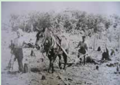
戦後開拓の様子 農耕馬を使い畑地として土地を耕す

今、新冠がこれだけ発展したのは、開拓に携わった農業従事者が最大の功労者だと思っています。