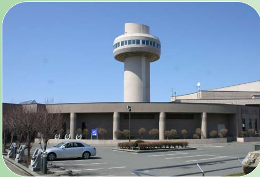
新冠町のシンボル「レ・コード館」。平成19年度、開館10周年を迎え、様々なイベントが催されました。

当時、新しい町のあり方を模索していた新冠町は、町を活性化するユニークなアイデアであると考え、「レ・コードと音楽によるまちづくり」という夢のようなまちづくりがスタートしました。