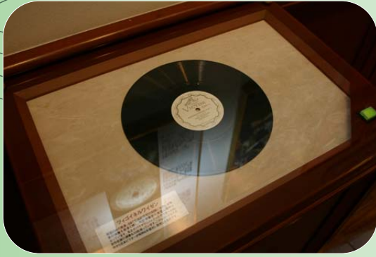
20世紀の文化遺産でもあるレコード。それぞれのレコードに思い出がつまっています。