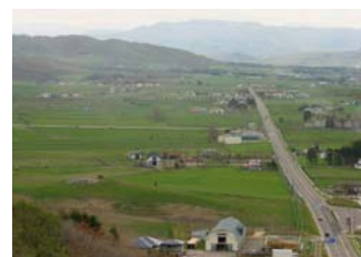
▲判官館森林公園から高江地区を望む