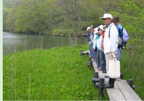
△ 苫小牧市錦大沼での自然観察の様子

主に5月から10月までは、月一回の定期観察会を行っています。平成22年度の活動は、判官館や岩清水、新栄、東川、泉で新冠の自然を散策しました。その他、様似町アポイ岳、浦河町井寒台、苫小牧市錦大沼でも観察も行ってあり、新冠のみならず日高や遠方の自然景勝地にも足を運んでいます。