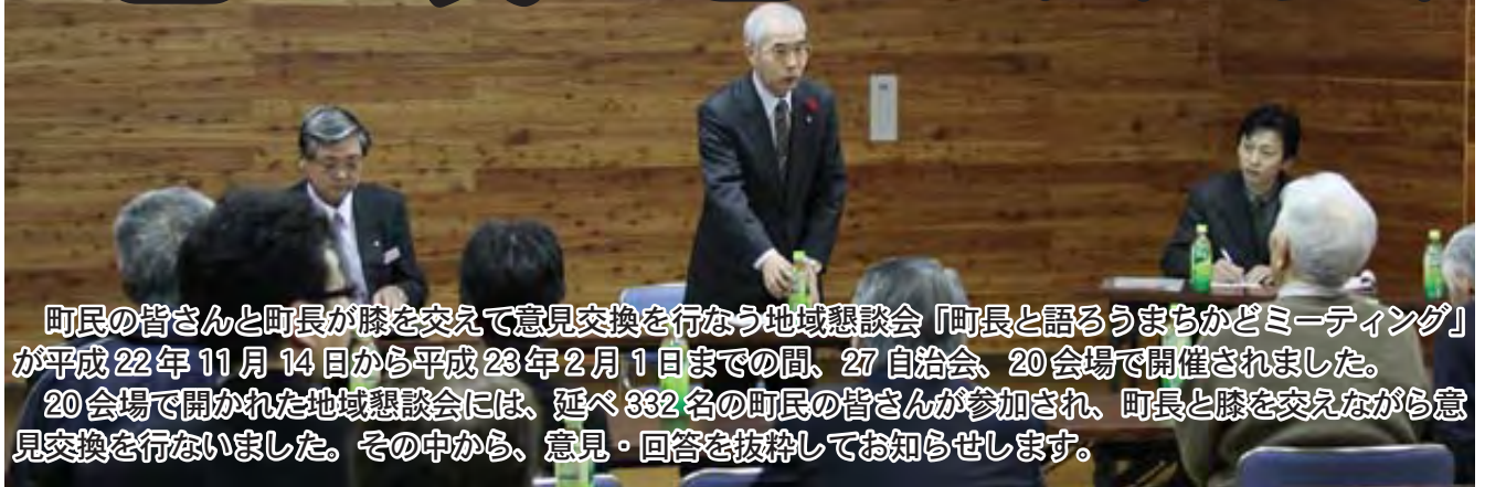
町民の皆さんと町長が膝を交えて意見交換を行なう地域懇談会「町長と語るうまちかどミーティング」が平成22年11月14日から平成23年2月1日までの間、27自治会、20会場で開催されました。20会場で開かれた地域懇談会には、延べ332名の町民の皆さんが参加され、町長と膝を交えながら意見交換を行いました。その中から、意見・回答を抜粋してお知らせします。

平成22年度地域懇談会は、昨年度まで実施していた町政懇談会を新たな形に変え、町民の皆さんと町長が膝を交えて意見交換を行なう「町長と語るうまちかどミーティング」として開催しました。また、地域担当職員制度を活用し、地域の声に素早く対応するため、地域懇談会と地域担当職員制度を連動させながら開催し、地域が抱える課題、町政への意見・提言など様々な意見交換を行ないました。