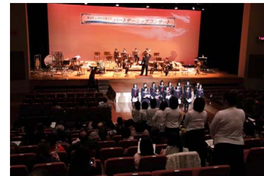
2月25日 パートナーシップ・コンサート

毎年恒例となっている昭和音楽大学とのパートナーシップ・コンサートが、新冠町開町 130 年・町制施行 50 年記念の締め括り事業として行われました。コンサートは、ド・レ・ミ園児による「ド・レ・ミ園歌」の合唱から始まり、フィナーレは、来場者全員で唱歌「ふるさと」の合唱を行いました。