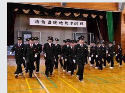
新冠消防団現地教育訓練

毎年恒例となっている昭和音楽大学とのパートナーシップ・コンサートが、新冠町開町 130 年・町制施行 50 年記念の締め括り事業として行われました。コンサートは、ド・レ・ミ園児による「ド・レ・ミ園歌」の合唱から始まり、フィナーレは、来場者全員で唱歌「ふるさと」の合唱を行いました。