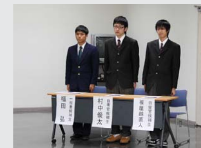
自衛隊入隊予定者激励会

2 月 19 日、スポーツセンターで新冠消防団全分団から 30 名が参加して教育訓練が行われました。この訓練は、団員に必要な礼式や基本動作を、消防署職員指導のもと行うものです。訓練では、班長の号令で集合や行進、敬礼など息のあった団体行動を見せていました。