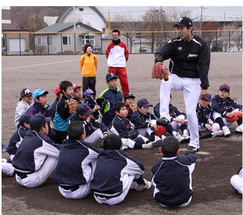
野球教室で指導を受ける子どもたち

また、NISPOとの協力連携事業として、5月11日「日ハム野球教室」を町民グラウンドにおいて小学生を対象に実施いたしました。当日28