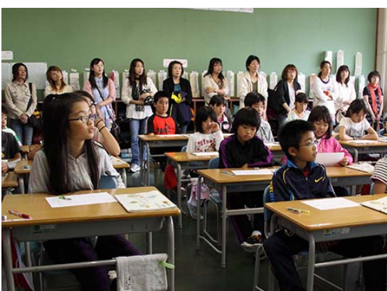
新冠小学校での参観日の様子

学校教育の推進について 「学ぶ意欲と確かな学力の育成について」 今年度の全国学力・学習状況調査