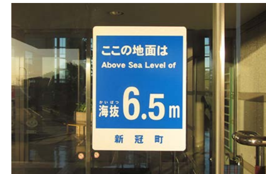
公共施設に設置された海拔表示シート

設置したのは、公共施設などの入口24ヶ所と町道沿いの電柱33ヶ所の計57ヶ所で、その地点の海拔を標示しています。普段から海拔を目にすることで、町内の安全な場所を把握し、津波の危険があるときには、できるだけ高いところへ避難することを心がけてください。