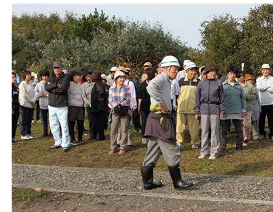
泊津の高台の避難場所の様子

また、職員も泊津生活館に災害対策本部を設置し、避難場所との情報伝達訓練や警察、消防との連携の確認を行いました。