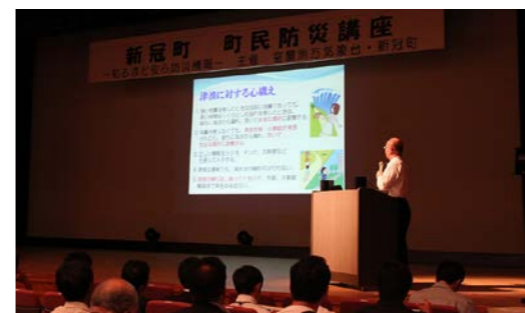
町民ホールでの防災講座の様子

防災講座は気象に関する予備知識や、災害に対する心構えなどを学ぶ場として、室蘭地方気象台が業務の一環として行っている事業で、この日は、新冠町に関連する災害として、大雨洪水と地震津波を題材に講演が行われ、約180名の町民が来場しました。