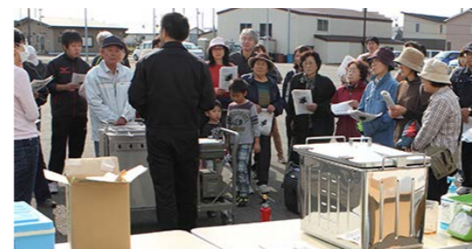
炊き出し訓練の様子

避難訓練終了後には、新冠消防署裏駐車場において中央自治会による炊き出し訓練が行われました。