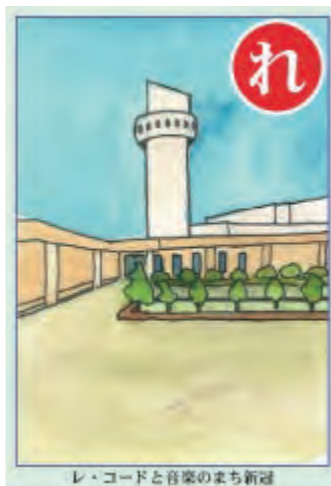
レ・コードと音楽のまじり

文字サイズは書籍によって異なります。 大きな文字での快適な読書をお楽しみください。