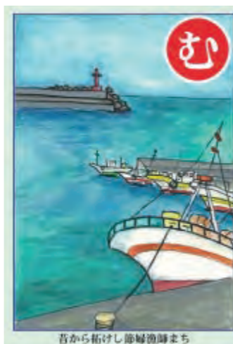
昔から拓けし節婦漁師まち