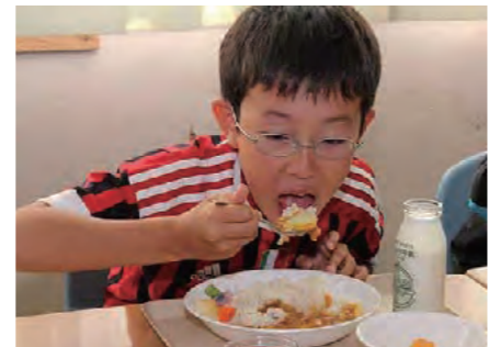
カレー大好き！モリモリ食べます！