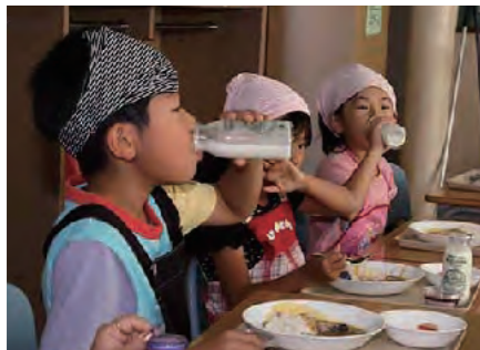
いつもの牛乳より濃くておいしい！