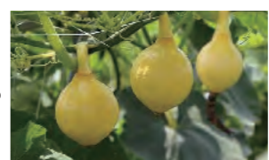
黄色が鮮やかなコリンキー