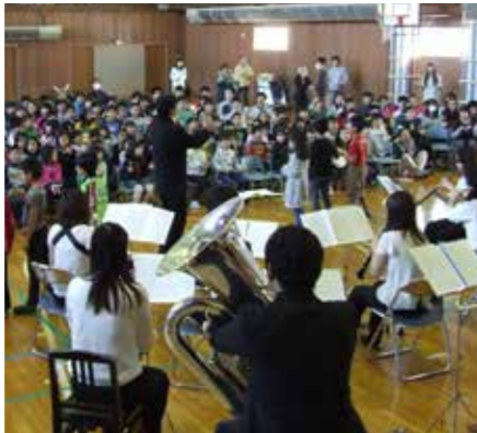
新冠小でのアウトリーチコンサート

はじめに豊かな心身の育成についてですが、2月26日、新冠小学校、新冠中学校において昭和音楽大学のアウトリーチコンサートが開催され、レ・コード&音楽による町づくりの特色を生かした教育を進めるなかで、直接、質の高い芸術に触れることにより情操教育としても豊かな心を育むことができました。