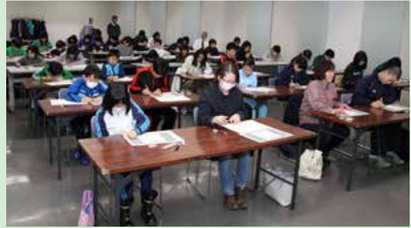
2月5日に開催した漢検の試験会場の様子

サークルの活動は、検定の運営という地味なものですが、子どもたちの試験に取り組む真剣な表情や、さらに上級レベルに挑戦しようという「やる気」を応援するため、これからも活動を続けていきたいと思えます。