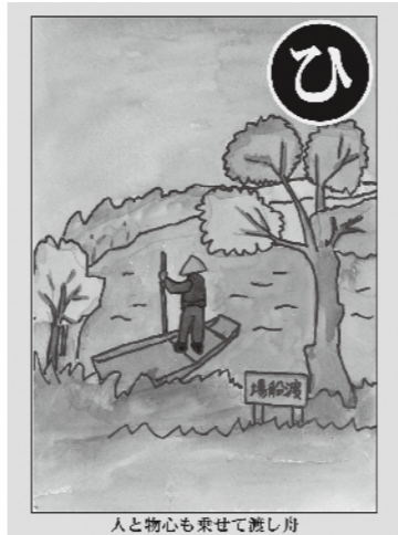
人と物心も乗せて渡し舟