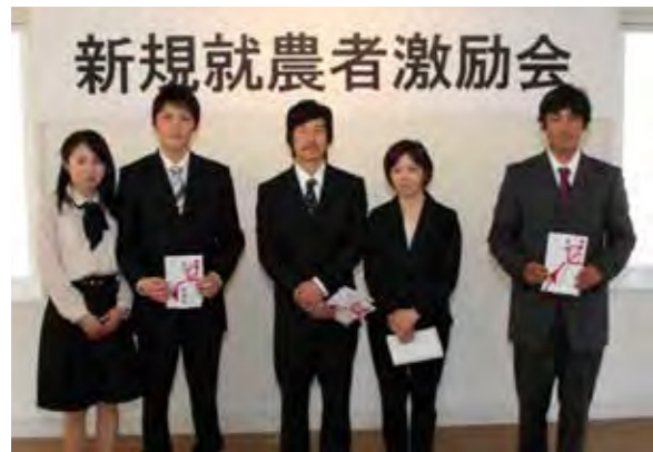
緑丘で営農を始めた3組の新規就農者

農業以外にお勤めの方が仕事を辞め、一から農業を始めるには、並々ならぬ決意と多額の投資を必要といたしますが、当町では平成20年度に就農施設整備補助金制度を設け、農業資産の取得に対する支援を行うとともに、平成23年度からは地域おこし協力隊・農業支援員制度の運用を始め、研修先となる受入農家の協力を頂きながら、農業生産に係る技術の取得と経営ノウハウを学べる機会を設け、担い手としての資質の向上を図るべく、ソフト・ハードの両面における事業の充実を図って参りました。