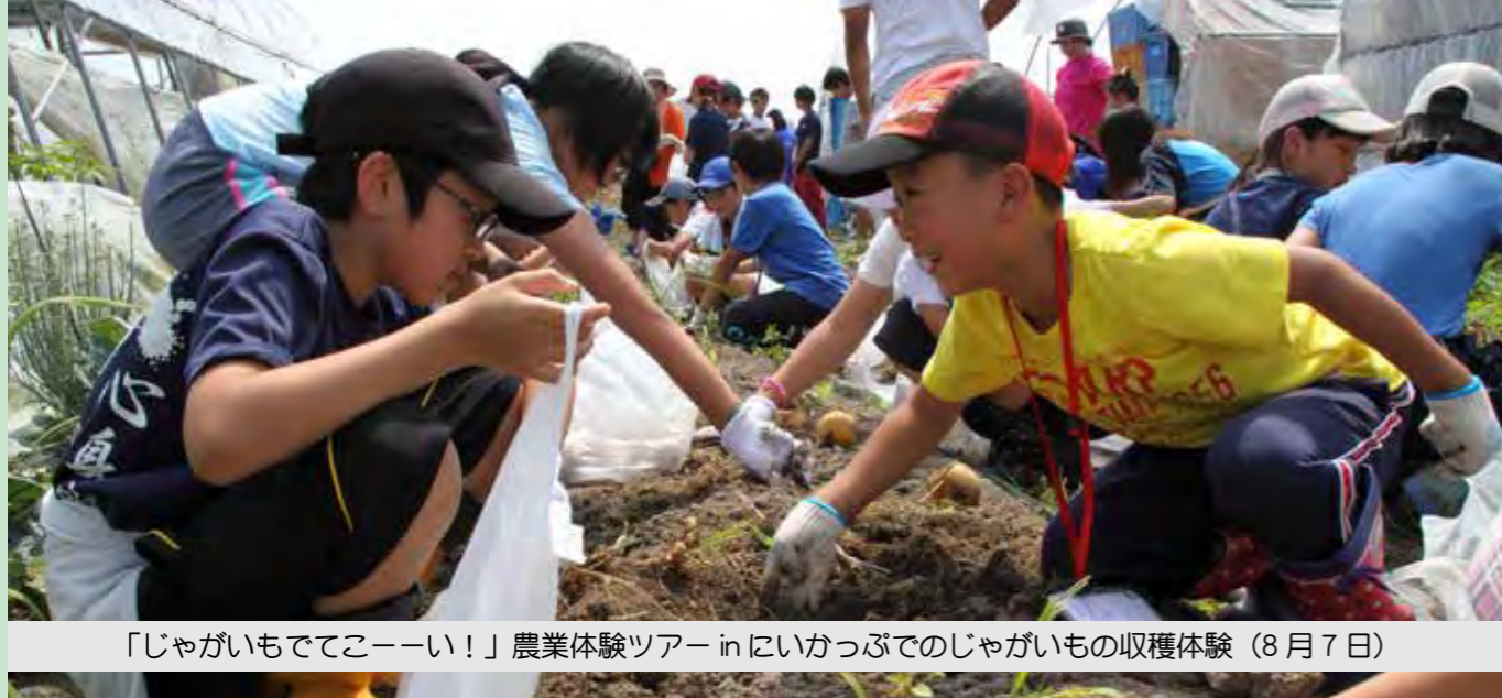
「じゃがいもでてこーい！」農業体験ツアー in いかっぶでのじゃがいもの収穫体験（8月7日）