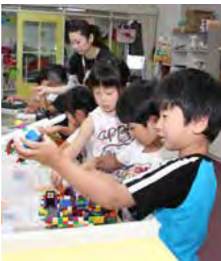
児童館で遊ぶ子どもたち

3 認定こども園ド・レ・ミの教育・保育について 4月27日、保育教諭が朝日小学校まで出向き、体育専科教諭から縄跳びの実践について指導を受け、体力向上に向けた幼小中の取り組みをスタートさせました。また、5月22日には、認定こども園ド・レ・ミにおいて第1回園内研修を開催し、「乳児の発達と愛着形