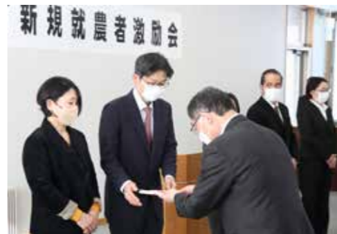
令和5年1月31日 農業支援員新規就農激励会

り組んできました。 このような中、令和2年度にご家族とともに当町へ移住し、農業支援員として活動されてきた3名の方々が、本年度までの研修プログラムを無事終了し、農業者として新たに独立就農されましたので報告します。