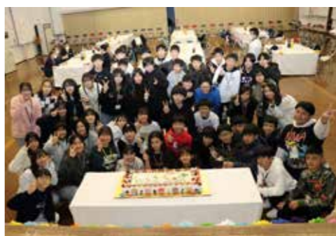
令和5年2月23日 少年国内研修交流受入事業

7 令和4年度新冠町少年国内研修交流事業 本年、1月11日から14日の日程で児童生徒、引率を含め35名を沖縄県へ派遣し、3年ぶりとなる少年国内研修交流事業を実施しました。新型コロナウイルスの感染が減少傾向に向かい始めた時期であり、研修内容の見直しや渡航前後の健康観察、マスク着用の徹底など、慎重に事業を進めてきました。現地では天候に恵まれ、沖縄の自然と歴史、文化を学ぶ行程を計画どおり進めることができ、金武町中川区子ども会との交流についても、当町からはゲーム形式での町の紹介や子ども会からは伝統芸能の披露を受けるなど交流を深めることができました。