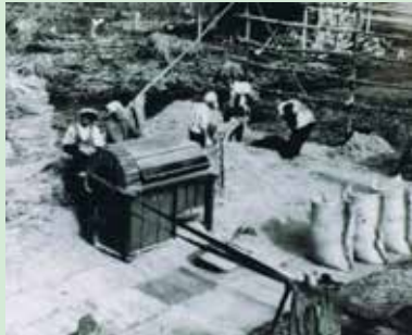
朝日付近での戦後の様子 (作物の脱穀作業)

私は、若い頃から農民運動として同盟に所属し、その勢いで御料牧場の解放運動を行った。やはり組織活動をしなければ農村は良くならないと実感している。