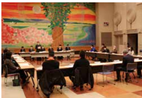
令和5年2月1日 マイタウン30委員会

町が行う広報広聴事業には、さまざまな手法がありますが、意見を述べやすい環境の構築と適時適切な開催は、行政の創意工夫が必要とされることであり、今後において試行錯誤を繰り返していきたいと考えています。