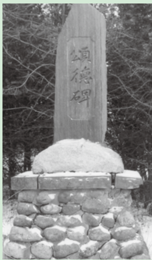
頌徳碑 東泊津の開拓のはじまりを刻む石碑

当時、搾った乳は湧き水で冷やしておきます。湧き水が近くにある人は苦労がないけど、そうでない人は大変です。早く冷やすことが細菌の増殖を防ぐ絶対条件だからです。このようなことが、後の本格的な集乳所設置へとつながっていったのです。