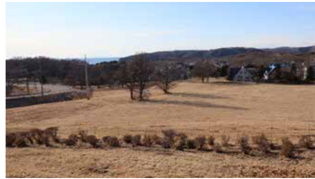
日高徳洲会病院の移転建設地に決定した字西泊津の町有地

状況が一変したのは、昨年末に日高徳洲会病院から理事長面談の機会を設けるとの連絡と共に、当町への移転を前向きに検討すると