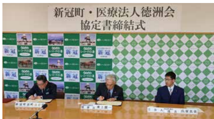
3月10日に行われた医療法人徳洲会との協定書締結式

今、新冠町のまちづくりは転換期を迎え、大きな飛躍のチャンスの中にあると感じています。日高徳洲会病院の新冠町への移転新築は、新たなまちづくりの礎であり、これまで多くの先人たちが積み上げてきたまちづくりを、更に充実させる分岐点です。更なる飛躍のためには、まちづくりを行政と議会、そして町民の協働によって進めなければなりません。