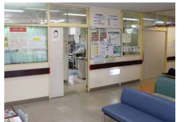
現在の新冠町立国民健康保険診療所

ります。このため、別に町が単独で補填している1億3千万円との合計額2億6千万円の財政的支出を、国保診療所の運営のために負担することとなります。更には、数年後に国保診療所本体の老朽化は限界を迎え、巨額の工事費を伴う改築