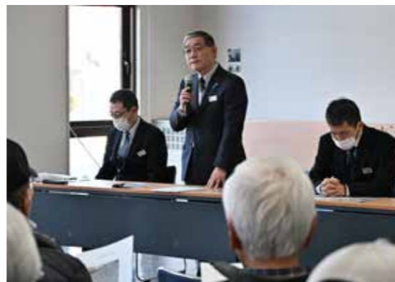
3月8日に行われた説明会の様子

また、全町民を対象とする説明会を3月8日に開催し、これまでの経緯、徳洲会病院との協定の概要を説明しました。参加した町民からは、町の医療サービスの向上につながるとして日高徳洲会病院の立地を喜ぶ声もありましたが、地域住民への配慮が不足しているという意見と企業誘致の経緯についての批判があり、改めて今後における丁寧な町民対応の必要性を感じているところです。