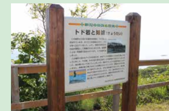
大狩部の御野立所公園には、トド岩と姉妹の伝説を紹介する看板を掲げている。ここからは、トド岩の様子を眺めることができる。

ある日のこと、このラオマプで踊っているうちに舟が波で流されいった。すると、二人の姉妹が岩にとり残されてしまった。一人の娘は裸になって一生懸命泳いだので、なんとか岸まで着いて助かることができた。