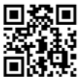
YOSAKOI ソーラン祭り公式ホームページ

●お問い合わせ先 YOSAKOIソーラン祭り 実行委員会 ☎011・231・4351