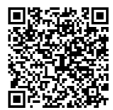
北海道人事委員会 会ホームページ

北海道庁では、試験研究機関や農業関係団体と連携し、農業の生産性向上、農業経営や農村生活の改善などに関する技術や知識を農業者に普及指導する普及職員を募集しています。 令和7年度北海道職員採用試験の予定は次のとおりとなっております。 ○普及職員(農業) A区分(大学卒業または卒業見込みの方) ・申込受付 4月14日(月)～5月19日(月) ・採用予定数 10名 ○普及職員(農業) A区分(専門試験口述型 第2回)(大学卒業または卒業見込みの方) ・申込受付 7月18日(金)～8月18日(月) ・採用予定数 5名 ※農業に関する専門知識を面接