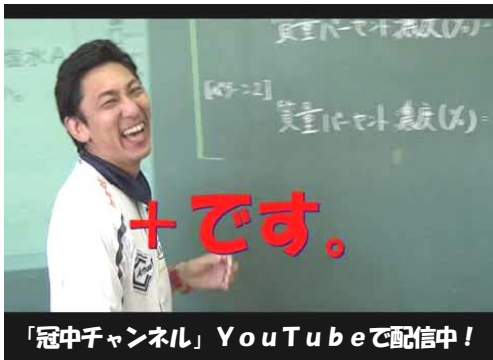
「冠中チャンネル」YouTubeで配信中!

児童生徒の皆さんは、これまで、当たり前のように登校していた学校に行けない現在の状況をどのように感じて過ごしているのでしょうか。外出を控えた家での生活、友だちと会えない日々、授業を受けることができない不安など、とても息苦しい毎日が続いていることかと思えます。また、この状況は、子どもたちと同様に保護者の皆さまにとっても大きな負担となっていることかと思えます。日々の生活の中で、不安なこと、相談したいことなどがありましたら、遠慮せずいつでも学校や教育委員会に相談してください。