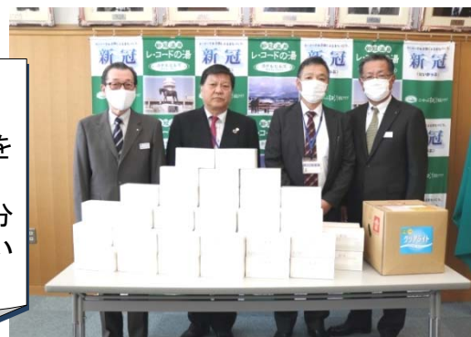
(株)道南様よりマスク及び次亜塩素酸水を寄贈いただきました。

いただいたマスクは小中学校及び認定こども園に配分し、教育委員会の備蓄品として有効適切に活用させていただきます。心より感謝申し上げます。