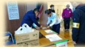
・避難所運営のお手伝い