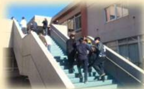
・避難訓練の参加