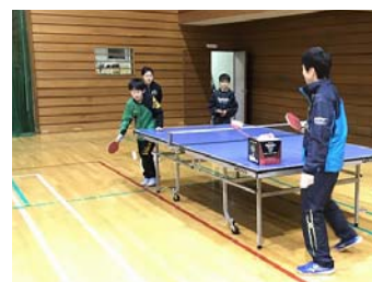
昨年度の様子 左からサッカー 教室、カローリン グ教室、卓球教室

何かご不明な点がございましたらお手数ではございますが町民センター（47-2106）までお問い合わせください