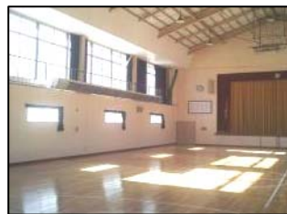
※写真は左から、スポーツセンター、トレーニングルーム、節婦体育館です。