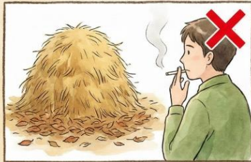
燃えやすい物の近くでの喫煙