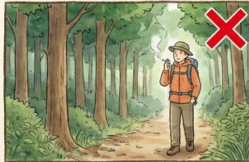
山林周辺での喫煙