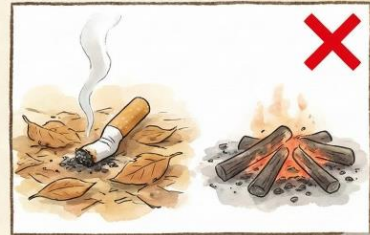
吸い殻、残り火の放置(後始末徹底)