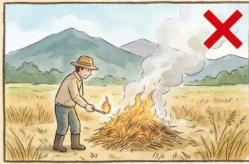
山林・原野での火入れ(野焼き)