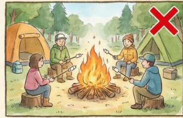
屋外でのたき火・火遊び