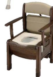
ポータブルトイレ