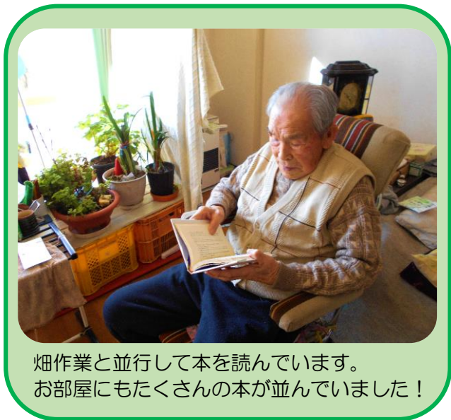
畑作業と並行して本を読んでいます。 お部屋にもたくさんの本が並んでいました！