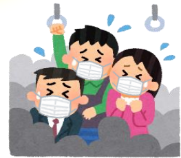
混雑した乗り物の中