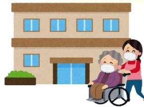
高齢者施設など に行くとき