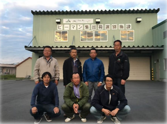
ピーマン生産部会 役員